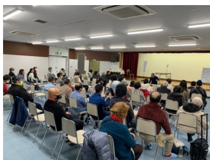
みんな、わくわく！次は何かな？