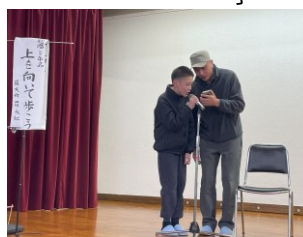
歌「上を向いて歩こう」と手品