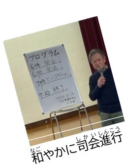
和やかに司会進行