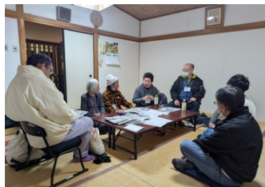
思い思いに意見を出し合う(和室にて)

6年余が経ちました。今、私たちは、こう叫びたい。 「地球丸よ、日本号よ、もっとゆっくり進もうよ。」