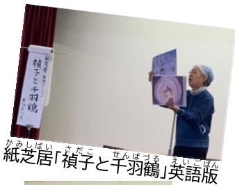
紙芝居「禎子と十羽鶴」英語版