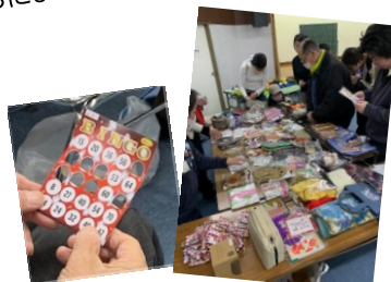
ビンゴの豪華景品