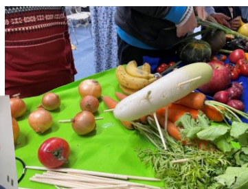
子どもたちによるクイズ「野菜が動物になる」