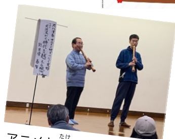
アニメと竹でつなぐ友好 演奏「時代を超える思い」