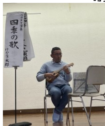
ウクレレ演奏「四季の歌」