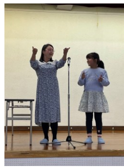
手話と歌唱 「你笑起来真好看」